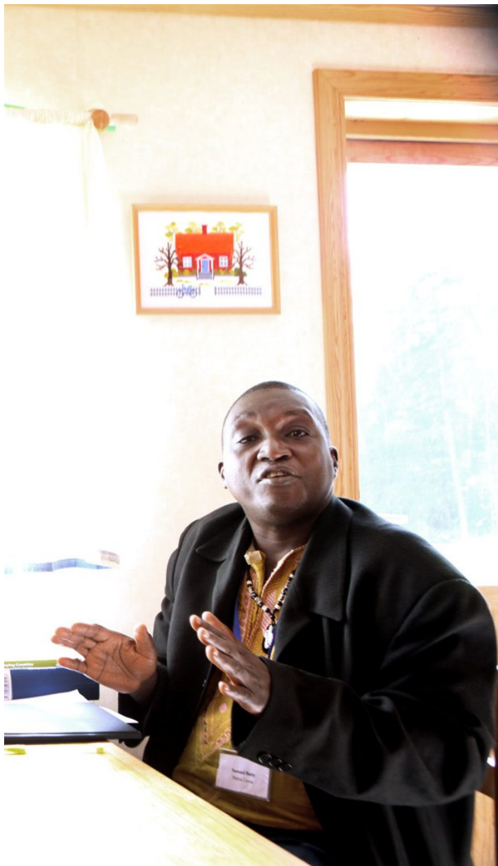
kurs i Rute på norra Gotland.